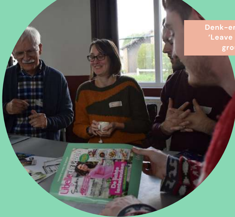
Denk-en doedag 'Leave it in the ground'